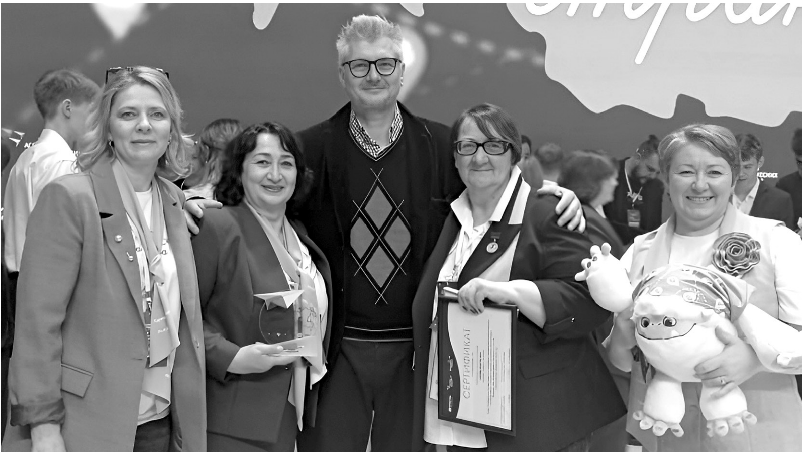
Представители команды Карачаево-Черкесии на церемонии награждения

«Эта победа — не только результат усердной работы нашей