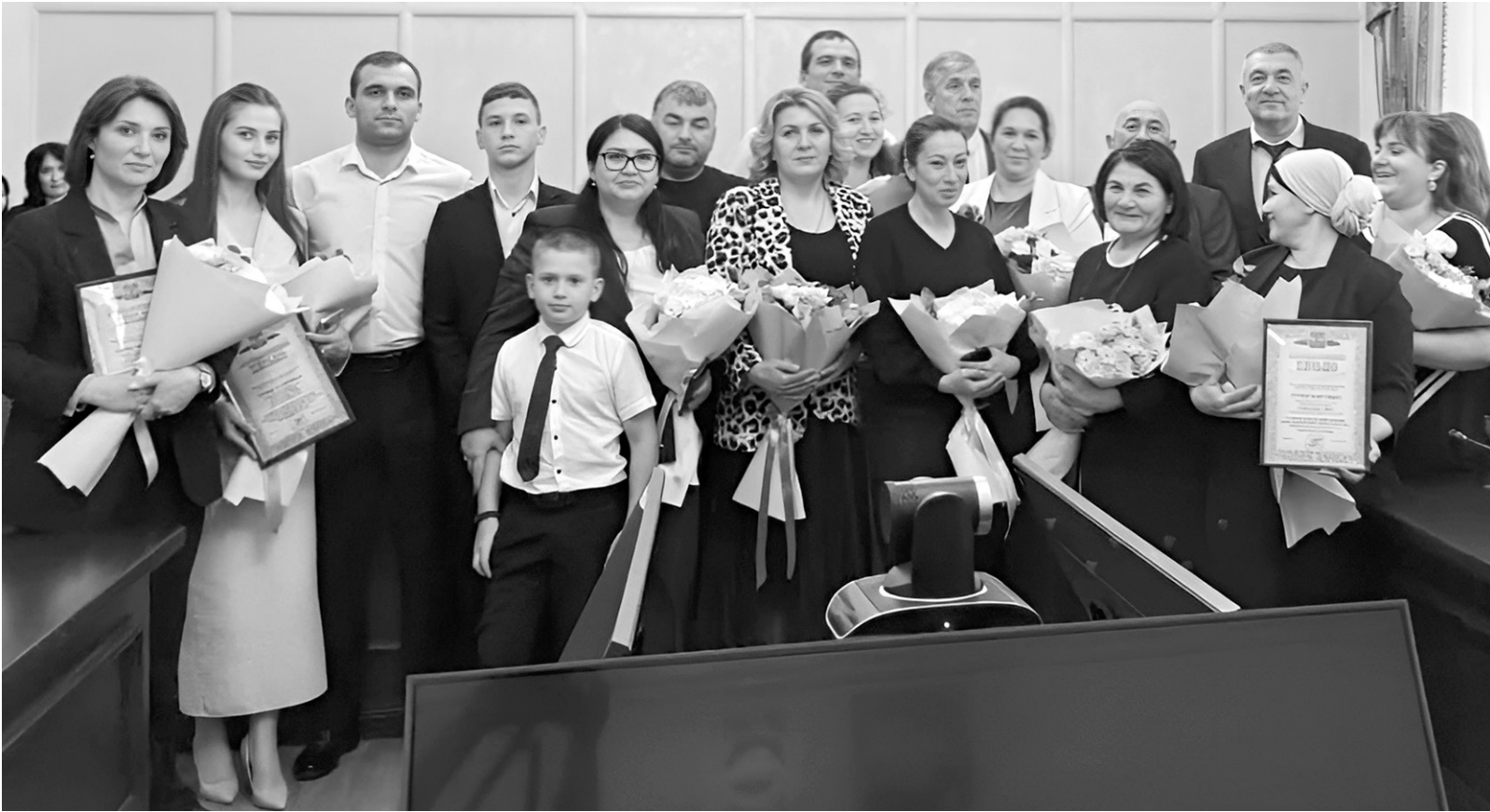
Победителям вручены благодарственные письма и ценные подарки

Всероссийский конкурс «Семья года» в этом году проводится в десятый раз. Организаторами конкурса являются Министерство труда и социальной защиты РФ, Фонд поддержки детей, находящихся в трудной жизненной ситуации, а также органы исполнительной власти субъектов РФ. Ежегодно по всей России в конкурсе принимают участие более 4000 семей.