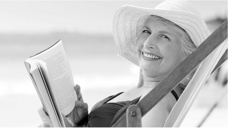
Людям с заболеванием щитовидной железы следует ограничить время пребывания на солнце

При этом не забывайте насыщать организм водой, лучше охлажденной, без газа. Пациентам с гипотиреозом очень полезна природная минеральная вода с повышенным содержанием гидрокарбонатов и малым количеством хлоридов. В качестве источника жидкости можно использовать арбузы, которые полезны при гипотиреозе своей насыщенностью сахарами. При этом выпиваемую воду мы не